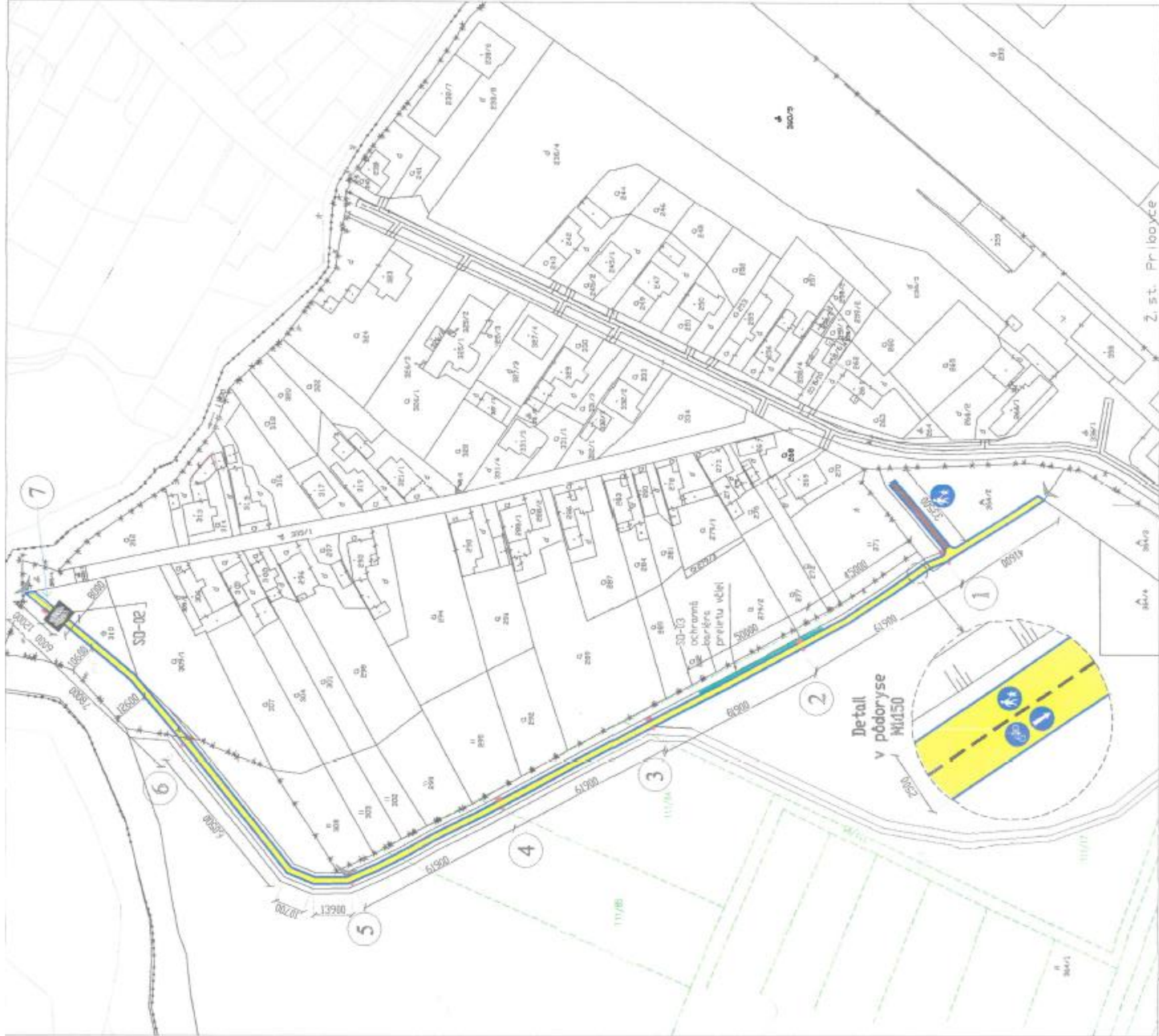
SITUÁCIA M1: 1500